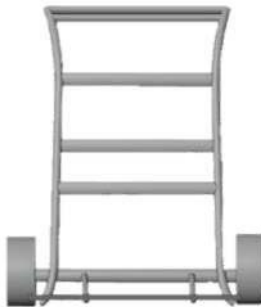
Gambar 3. Troli barang tampak depan