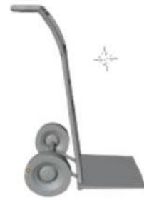
Gambar 5, Gambar troli tampak kiri