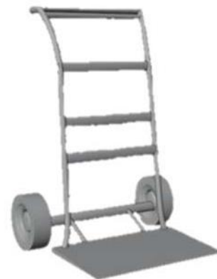
Gambar 6. Troli barang tampak isometrik