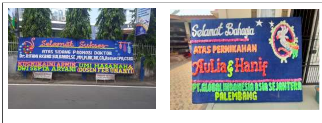
Gambar 2 : Dokumentasi Pengabdian